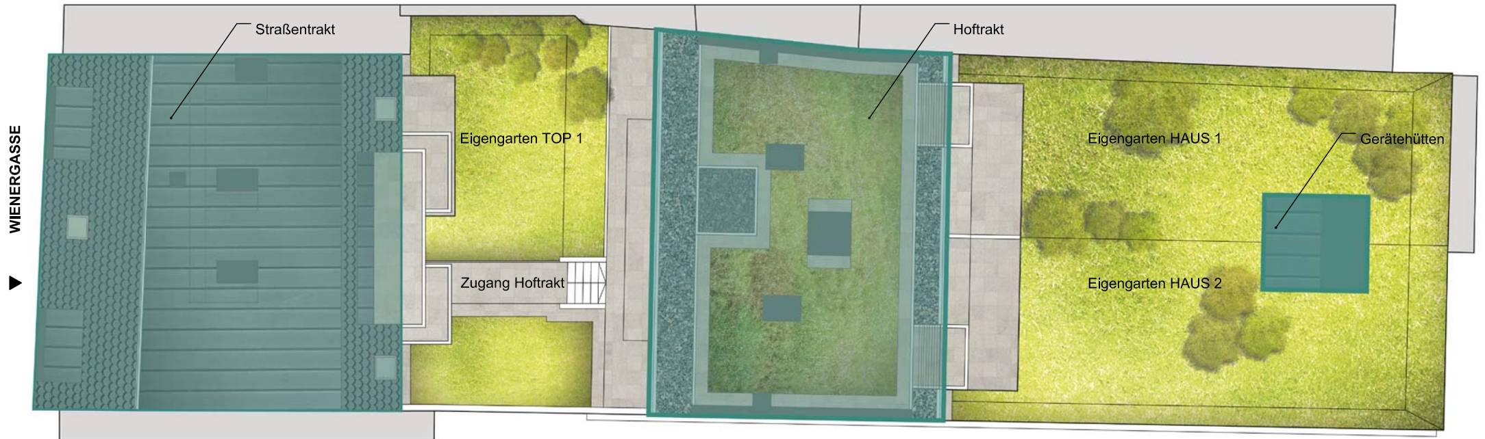
GRUNDRISS EG M 1:200